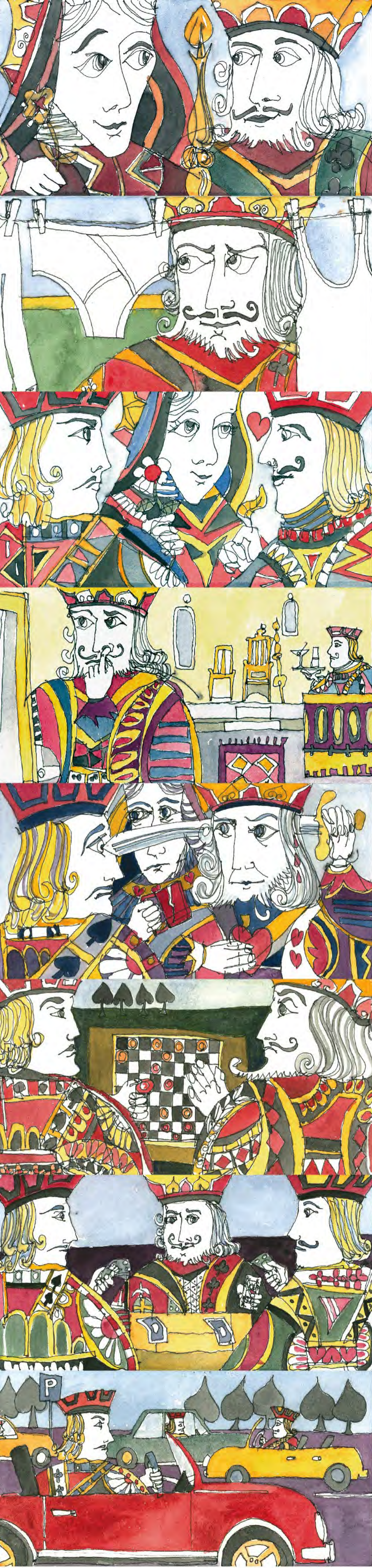
Φίλιππος Φωτιάδης Φιγούρες, Ίντριγκες & Σαχλά Λογοπαίγνια