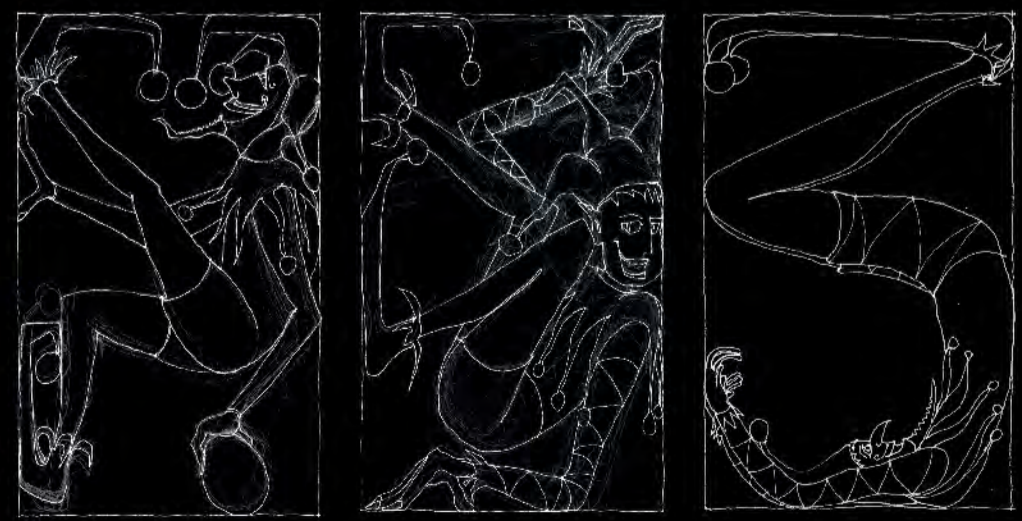
Φίλιππος Φωτιάδης Φιγούρες, Ίντριγκες & Σαχλά Λογοπαίγνια